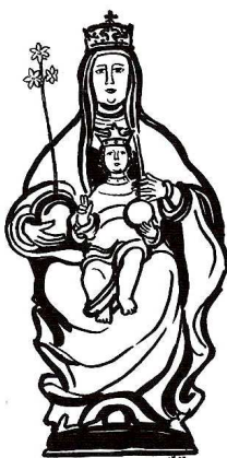
Socha Madony z Montserratu

U sv. Jana Kř. u kapucínů ve všední dny v 7.30 h růženec, v 8 h mše sv. a zpívané litanie.