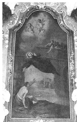
u sv. Michala