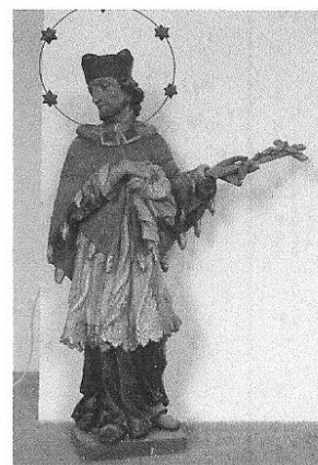
u sv. Václava