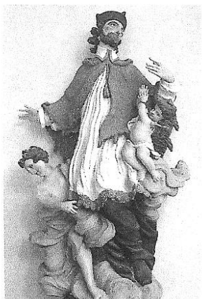
u sv. Mikuláše