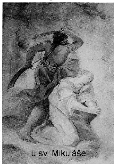
u sv. Mikuláše