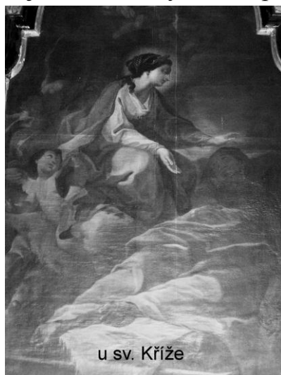
u sv. Kříže

zemřela, krutý otec vedl dceřinu výchovu v ryze pohanském duchu, dle tehdejší helénistické kultury. Aby ji ubránil před zlými vlivy okolního světa, zejména před tehdy stále zakázaným křesťanským učením, uvěznil dceru v kamenné věži, kde ji obklopil vším přepychem. Jeden z přítomných sloužících byl však tajným křesťanem a přivedl Barbaru k víře. Jakmile se to otec dověděl, chtěl ji donutit zřici se