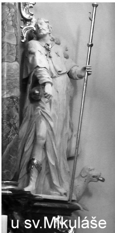
u sv. Mikuláše

nikdy v církvi úřad, patří dodnes k nejoblíbenějším a velmi ctěným postavám církve.