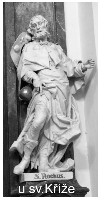
u sv. Kříže

Sv. Roch je vzýván jako patron zajatců, nemocných a nemocnic, lékařů, lékárníků, chirurgů, sedláků, obchodníků s uměleckými předměty, zahradníků, kartáčníků, truhlářů a dlaždičů; a také jako přímlyvce proti moru, proti nákazám, proti choleře, vzteklině, chorobám nohou a kolenou, proti neštěstí.