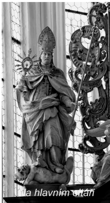
na hlavním oltáři