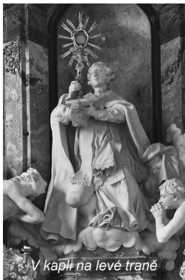
V kapli na levé traně

biskup a zakladatel řádu. Narozen ve Xanten asi r. 1080; zemřel v Magdeburku 1134; kanonizován v r. 1582; svátek má 6. 6.