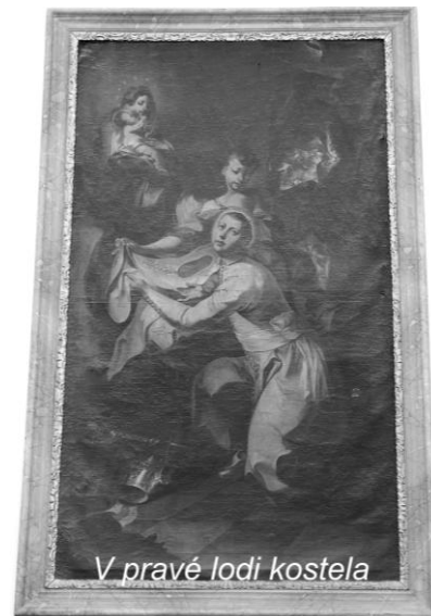
V pravé lodi kostela

Pocházel ze vznešené rodiny z Porýní a do svých 35 let žil světským životem u císařského dvora, i když měl nižší svěcení a držel řadu obročí. Náhle se však zcela změnil, prý poté, co ho málem zasáhl blesk. Byl vysvěcen na kněze, ale jeho reformní nadšení podráždilo některé xantenské duchovní, kteří ho r. 1118 označili za pokrytce, který káže, ač k tomu nemá oprávnění. Norbert potom odevzdal své statky chudým a vydal se na cestu k papeži Gelasiovi II., který právě pobýval v Languedoku. Papež mu dal souhlas, že smí kázat, kde bude chtít, a Norbert toho hned využil k účinnému působení v severní Francii. Ve Valenciennes se spřátelil s mladým knězem Hugem z Fosses a v r. 1120 začali organizovat komunitu řádových kanovníků v Prémontré u Laonu. Z velmi skromných začátků se komunita rychle rozrostla v řád řeholních kanovníků, nazývaných