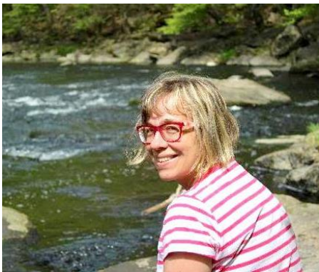
Spoluzakladatelka znojemského domácího hospice

Mí rodiče i prarodiče byli lékaři, doma se vždycky diskutovalo o medicíně, nikdy mě nenapadlo, že bych dělala něco jiného. K paliativní medicíně jsem měla cestu trochu složitější. Několik let po svém nástupu na ARO znojemské nemocnice jsem dostala za úkol ordinovat v ambulanci pro léčbu bolesti, tam ke mně začali přicházet kromě jiných i pacienti, kteří trpěli bolestmi v závěrečné fázi nevléčitelných onemocnění. Brzy jsem poznala, že bolest je jen jeden z příznaků, které je trápí a potřebují komplexnější péči. Začala jsem se zajímat o paliativní medicínu, lékařský obor, který řeší tuto problematiku. V roce 2010 jsem v tomto oboru složila atestaci.