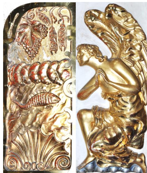
Vnější a vnitřní strana dveří svatostánku u Sv. Kříže

* Tabernákl je eucharistický svatostánek skříňkového tvaru. Název pochází z latinského slova označujícího stan.