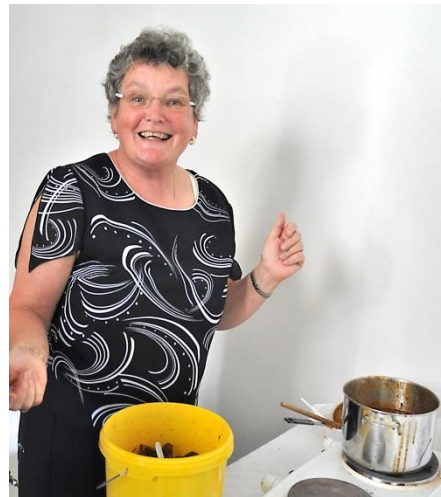
Oslavenkyně v akci

Milá paní Findová, přejeme a vyprošujeme Vám hodně Božího požehnání do dalších let!