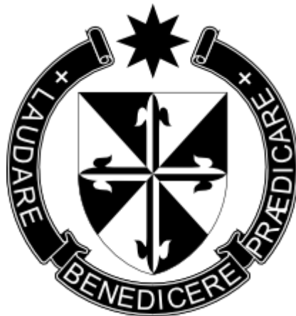
Znak dominikánského řádu s heslem: chválit, dobrořečit, kázat.

Tedy svědčit o Bohu vlastním životem a nebát se o něm hovorit. „Kazatelský řád“, jak se také dominikáni nazývají, znamená velmi široké pole působnosti. Výuka náboženství, psaní