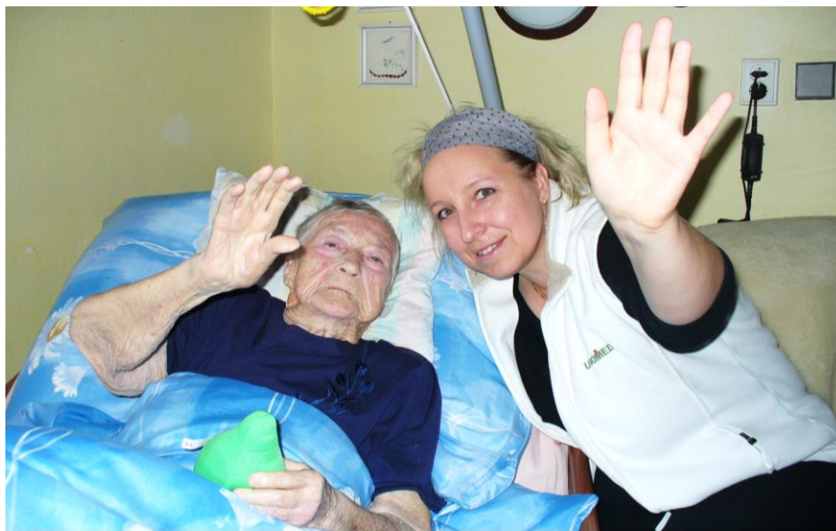
Pomocná ruka charitní ošetrovatelky v domácí hospicové péči.

V české společnosti jsou rozhovory o smrti stále ještě do jisté míry tabu. O posledních věcech člověka se bojíme mluvit, abychom se nerouhali, nebo proto, že na to máme ještě čas. A když s námi chce o smrti mluvit blízký člověk,