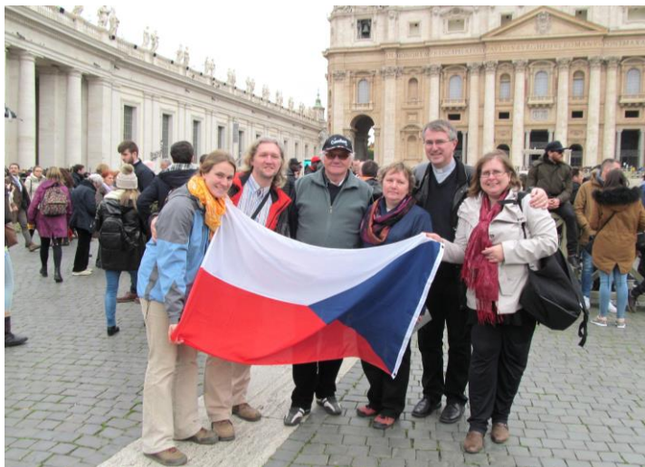
Na svatopetrském náměstí po společné nedělní modlitbě Anděl Páně s papežem Františkem