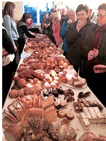
Pekařská pouť