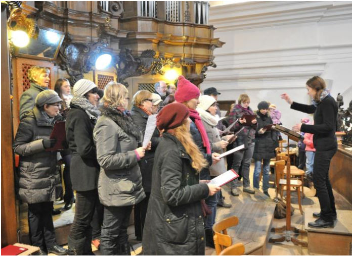
Chrámový sbor sv. Kříže při otvírání Svaté brány

Prožíváme radostné Velikonoce, jarní a jásavé melodie plní naše srdce a ladíme se na novou notu. Naše sbormistryně jako velikonoční repertoár vybrala tentokrát Fibichovu Missu brevis, tedy „krátkou mši“, kterou sbor provede během velikonočních svátků a poté v rámci již tradičního koncertu velikonoční hudby u sv. Kříže 3.4.2016. V našem po-