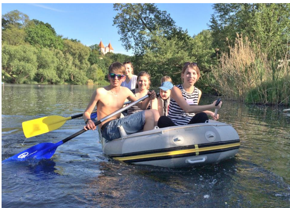
Farní den se tentokrát odehrával nejen na souši ale i na vodě

Na farní zahradě byly pro děti nachystány různé atrakce – vyrábění větr-