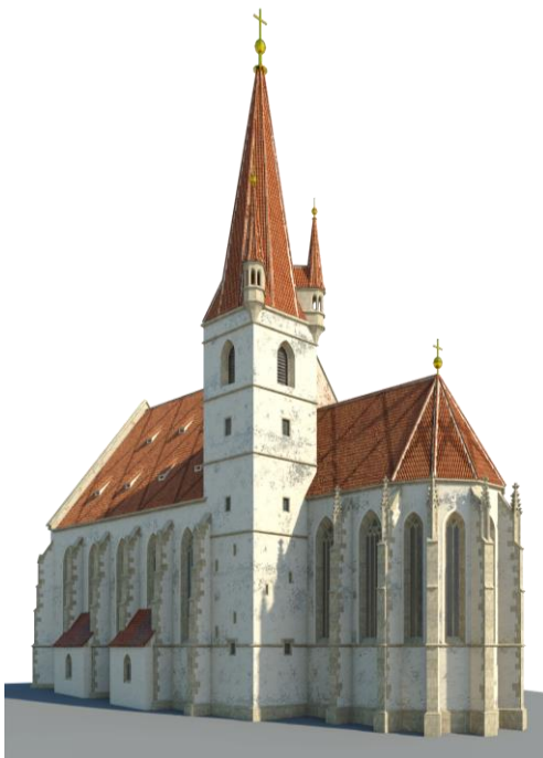
Vizualizace kostela sv. Mikuláše v podobě kolem roku 1500 / autor Arch. Vratislav Zíka

Letos si celá Evropa a obzvláště české země připomínají 700 let od narození jednoho z největších středověkých vládařů, moravského markraběte, později krále českého a císaře římskoněmeckého, Karla IV. Lucemburského. Latinskou zádušní mší u sv. Mikuláše v den narození 14. května a dvěma výstavami na znojemském hradě si jej připomínáme i u nás ve Znojmě. Pojďme si společně připomenout alespoň zlomek stop jeho působení v našem městě.