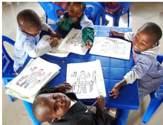
Vzdělávací projekty v Angole