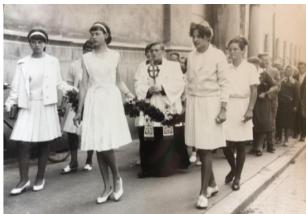
Primice P. Miholy u Sv. Kříže

24. června uplyne 630 od narození sv. Jana Kapistrána , apoštola Evropy. Tento italský právník a politik v roce 1416 vstoupil do nejprůběžnější reformní větve řádu sv. Františka. Při své misijní cestě střední Evropou se se svými spolubratry zastavil i ve Znojmě, kde koncem září 1451 kázal. Zemřel 23.10.1456 krátce poté, co se významně zasloužil o vítězství křesťanských vojsk nad Turky u Bělehradu.