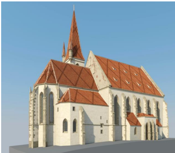
Vizualizace kostela sv. Mikuláše v podobě kolem roku 1500 / autor Arch. Vratislav Zíka

k osobní návštěvě regionu. Odškodnil znojemské měšťany za všechny prodělané újmy několika privilegií a zajel osobně do Pulkavy. Jeho cesta byla doprovázena obrovským hejnem přemno-