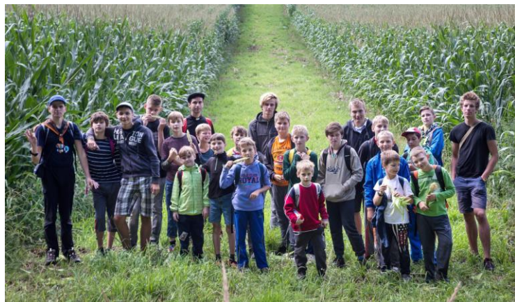
Táborníci v kukuřici