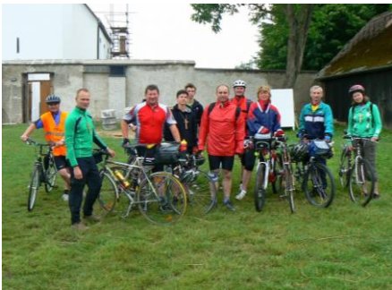
U číhoštské fary