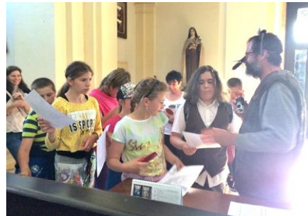
Maskot Noci kostelů – kostelní myš

V každém kostele byl k dispozici pas. Účastníci mohli získat razítko a odměnu za splnění úkolů. U sv. Michala například se noční návštěvníci mohli seznámit se skutky tělesného milosrdenství. V kostele sv. Kříže se schovávala zvířátka z Noemovy archy a Jonáš v břiše velryby. Návštěvníci také hledali odpovědi na otázky vážící se k biblickým textům o milosrdenství, lovili rybičky a modelovali z barevného těsta dárek pro Ježíška do jesliček. Odměnou jim byla placka s myškou. Návštěvníků bylo opravdu hodně, odhadem přišlo přes 200 dětí a nepočítaně dospělých. Letos se do společného dětského programu zapojila i farnost Louka. Kromě úkolů pro děti zde byl připraven i bohatý program pro dospělé s ochutnávkou vína a koncerty. Díky všem za snahu přiblížit kostely a tím i Krista lidem.