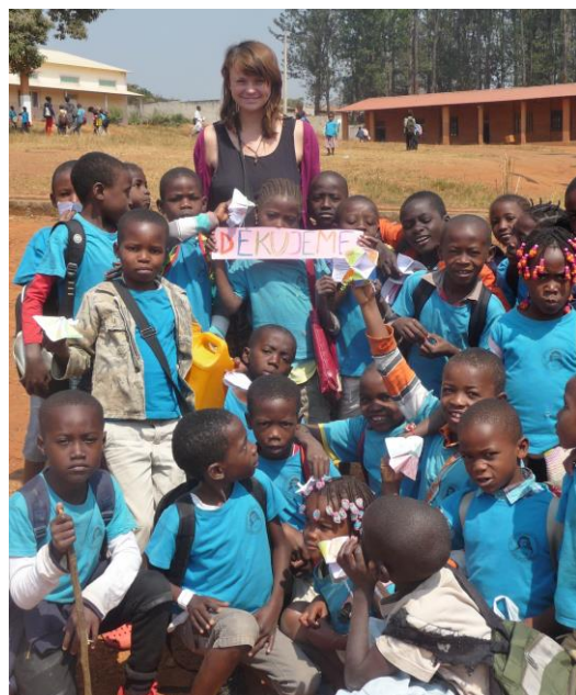
Pozdrav angolských dětí do ČR

Ráno jsem zpravidla měla malé děti. Moc se těšily, že budou něco malovat a tvořit. Většinou s sebou měly jen obyčejnou tužku a sešit, některé děti měly dokonce i žiletku - tzv. angolské ořezávkátka. Další potřebné věci jako barvy, bavlnky, nůžky a lepidla jsem jim půjčovala. Při každé příležitosti kolem mě utvářely hlouček, že chtějí jinou barvičku, ořezat pastelku nebo třeba vrátit nůžky. Na konci hodiny se hromadně chodily ptát, jestli si můžou výrobky odnést domů a když dostaly potřebné povolení, pobíhaly o přestávce hrdě se svými výtvary a ukazovaly je všem dětem okolo. Některé děti do školy chodily hladové a neměly ani svačinu. Díky finanční pomoci IniciativAngola jsou ale sestry schopné financovat jedno teplé jídlo pro každého žáka. Většinou je to trochu sladké jáhlové nebo rýžové kaše.