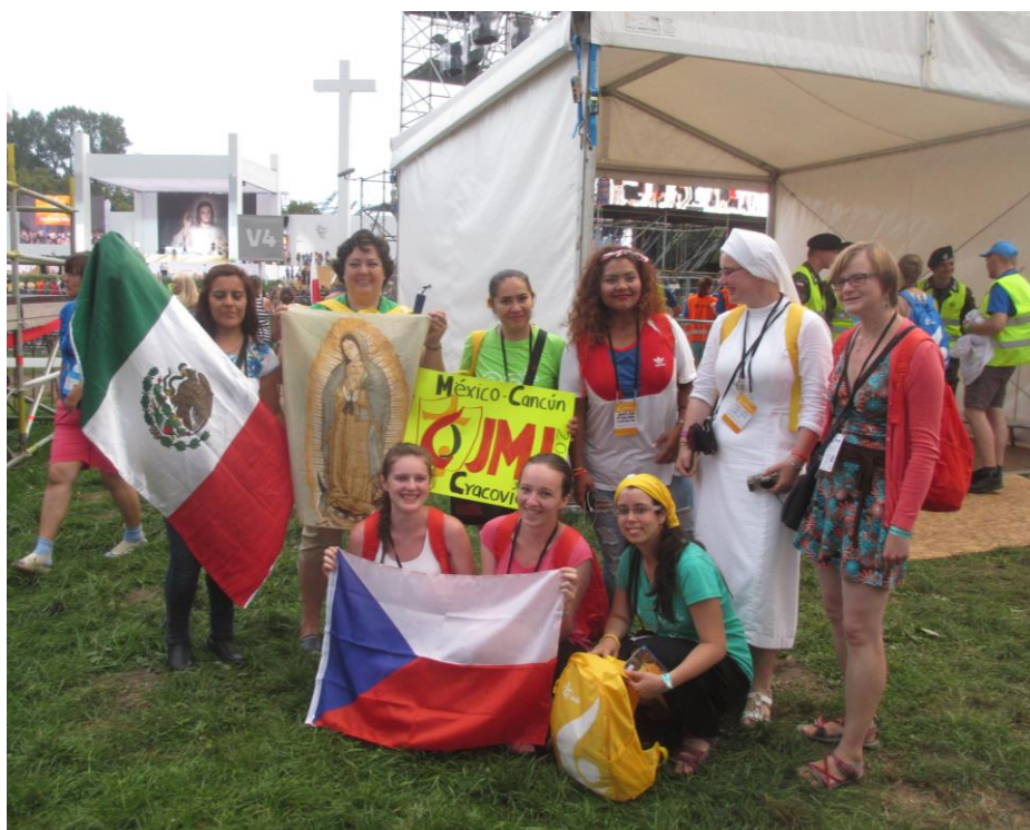
Česko-mexické setkání v polském Krakově

Druhý den jsme vyrazili opět do našeho národního centra, kde byl připraven program a katecheze. Program byl zajímavý a velmi zábavný. Vystála jsem frontu na kávu a po obědě vyrazíme tramvají do centra Krakova na zahajovací mši sv. Procházíme centrem stejně jako všudypřítomné davy. Začíná pršet a všichni vytahují nafasované pláštěnky, náměstí je plné modrých, žlutých a červených lidí. Navštívujeme hrad Wavel a přesouváme se na místo setkání. Celé prostranství střeží vrtulník, panuje zde