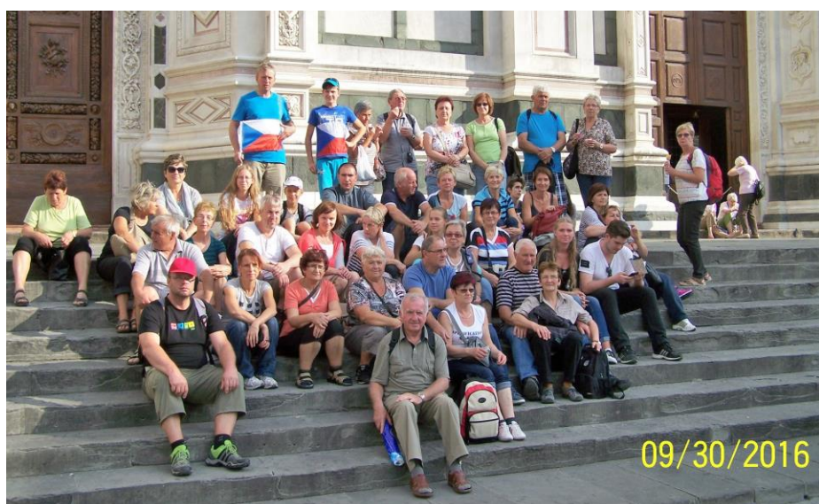
Poutníci před bazilikou Sv. Kříže ve Florencii

spolu s jedním pracovníkem z Fabriky San Pietro (jmenuje se tak organizace, která se stará o chod turistiky v bazilice sv. Petra), často marně vysvětloval, že tentokrát mají ve Vatikánu protekci Čechové. Někteří cizinci prošli tvrdíce, že mají tatínka Čecha. No a potom už byla mše svatá a po ní jsme šli za zpěvu svatováclavského chorálu k oltáři svatého Václava. Pomodlili jsme se modlitbu za náš národ a spokojení jsme se vrátili domů.