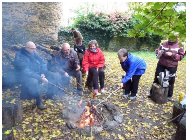
Senioři po „vyčerpávající“ prohlídce u táboráku

Při znojemských farnostech, jak mnozí víte, funguje KLAS (rozuměj Klub aktivních seniorů). Náš program je velmi pestrý. Máme různé přednášky na témata z náboženského i civilního života. Kromě toho pořádáme i různé výlety. Byli jsme například na Hardeku a také na Meteorologické stanici v Kuchařovicích.