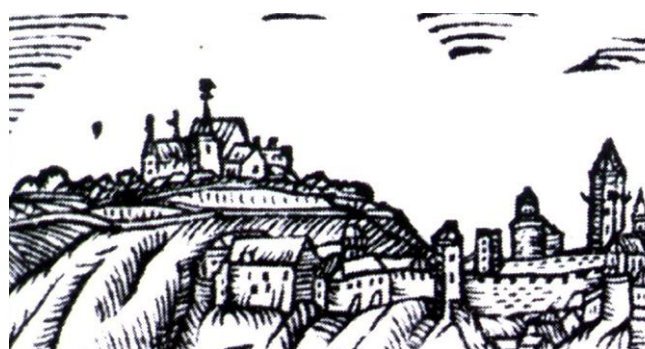
Hradiště na Willenbergově veduté z konce 16. st.

Ve 12. století, po reformách olomouckého biskupa Jindřicha Zdíka, přešla dosavadní ústřední funkce hradištského kostela na nový kostel sv. Michala na protilehlé straně Gránického údolí. Ten byl založen jako hlavní svatostánek pro rostoucí sídelní aglomeraci na předpolí nového znojenského hradu (založeného kolem roku 1100). Zatímco u sv. Michala se usadil arcijáhen, na knížeti nezávislý a přímo podřízený olomouckému biskupovi, u starého hradištského kostela zůstal panovníkův exponent, probošt (praepositus tedy "představený"). O prastaré vazbě kostela na Hradišti se znojemským sv. Michalem svědčí i fakt, že na dnešním Jezuitském náměstí stál až do třicetileté války dům hradištského probošta (dnes je parcela prázdná, vede přes ni tzv. severní přístupová cesta přes hradby).