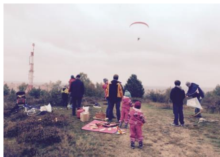
Vít tentokrát rozfoukala až vrtule parapludu otce Mariana

Potom, kde se vzal, tu se vzal, přiletěl otec Marián a jako tradičně „bombardoval“ děti bonbony a samolepkami. Možná rozvířil vzduchové proudy nad Kraví horou, protože když jsme zahájili doprovodný program, začalo foukat. Nakonec drakiáda opravdu proběhla s draky ve vzduchu. (gl)