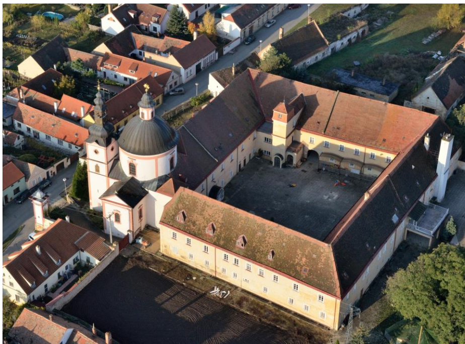
Pohled na kostel s proboštvím od východu (napravo od kopule je patrná nedokončená věž)

tantský předák Vilém z Roupova, zástavní pán znojenského hradu. Švédové zase vyplenili Hradiště v roce 1645. Bylo velkým štěstím, že panství tehdy spravoval probošt Gerhard ze Sclessinu, původem z říšského církevního knížectví Lutych (dnes Belgie). Ten během své vlády v letech 1627 až 1652 použitím inovativních metod hospodaření postavil rozvrácené panství opět na nohy, opravil a rozšířil budovu proboštví do podoby čtyřkřídleho zámku a v roce 1636 přestavěl starou kostelní věž do současné, pozdně renesanční podoby. Roku 1646 se Gerhard dokonce stal proboštem u kolegiálního kostela sv. Petra a Pavla v Brně (dnes biskupská katedrála).