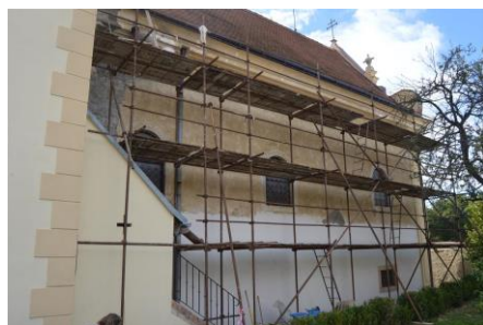
oprava fasády popického kostela

Další dotace, kterou zastupitelstvo schválilo, šla na opravu kostela sv. Mikuláše ve Znojmě. Opravila se fasáda a kamenné prvky presbytáře (I. etapa – jižní strana), omítky a výmalby interiéru. Opravu město dotovalo částkou 821 000 korun. (tisková zpráva města Znojma)