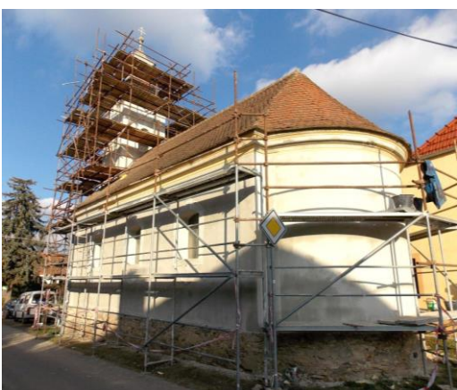
Kaple P. Marie Bolestné v Čížově – oprava fasády (345.000 Kč)