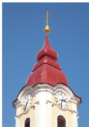
Kostel Nanebevzetí P. Marie v Hevlíně – II. etapa opravy střechy kostela vč. výměny krovu a oprava střechy věže vč. výměny krovu (955.000 Kč)