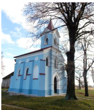
Kostelík P. Marie v Dyjácovících – II. etapa fasády (169.000 Kč)

Kostel sv. Kříže ve Znojmě – byla provedena rekonstrukce zázemí kostela: (4 x WC, kuchyňka a úklidová místnost), které byly z 60. let 20. stol. Zázemí bylo dožilé, výrazně degradované vlhkostí a neodpovídalo hygienickým normám a potřebám současnosti. Po otlučení dožilých omítek a vybourání příček a podlah byla provedena výměna inženýrských sítí: splaškové kanalizace, vodovodu a topení. Byla provedena sanace vlhkosti. Byly vystavěny nové příčky, doplněno zdivo, opraveny stropy a klenby, provedeny nové podlahy a schodiště, provedena výměna elektroinstalace, provedeny úpravy a vyzdívký s osazením sanitární techniky, vyměněny dožilé truhlářské prvky: okna a schodišťové stupně a dveře, provedeny nové omítky a obklady. Následně byla provedena výmalba. Celkové náklady činily 850.000 Kč. (Jihomoravský kraj 200.000 Kč, Biskupství brněnské 50.000 Kč, Klášter dominikánů Znojmo 50.000 Kč a farnost vč. účelových darů 550.000 Kč).