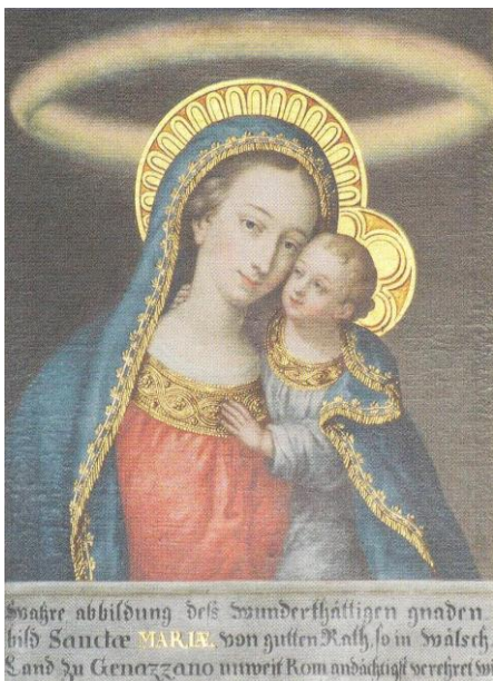
Obraz P. Marie Matky Dobré rady v kostele sv. Jana Křtitele ve Znojmě

Na bočním Mariánském oltáři v kostele sv. Jana Křtitele ve Znojmě je umístěn obraz Panny Marie Matky Dobré rady , který pochází ze 3/4 18. stol. a byl původně v inventáři kostela sv. Mikuláše na oltáři Nanebevzetí P. Marie. Staré sestry Spasitelky vyprávěly, že ho tam jednou při úklidu v kostele hledal nějaký starý muž s tím, že jeho rodina ho kdysi kostelu věnovala. Na stávající místo byl obraz přenesen při opravě kostela v roce 1994. Německý nápis na obraze dosvědčuje, že se jedná o kopii obrazu Matky Dobré rady z města Genazzano u Říma. Dne 25. 4. 1467 se na zdi kostela náhle objevil obraz Panny Marie s Ježíškem. Podle pověsti sem byl přenesen z Albánie, z města Scutari, kde právě Turci ničili kostel. Dva muži prosili P. Marii na obraze na kostelní zdi o radu, jak Turkům čelit a tu se obraz vznesl a putoval až do Genazzana a muži šli za ním.