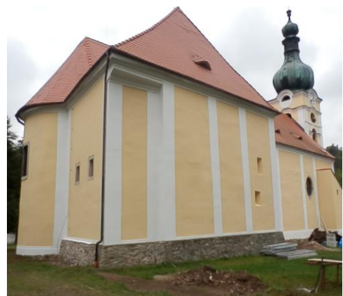
Kostel Nanebevzetí Panny Marie ve Vranově nad Dyjí – II. etapa opravy fasády a oprava interiéru věže (1.030.000 Kč)