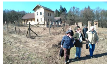
U myslivny sv. Huberta