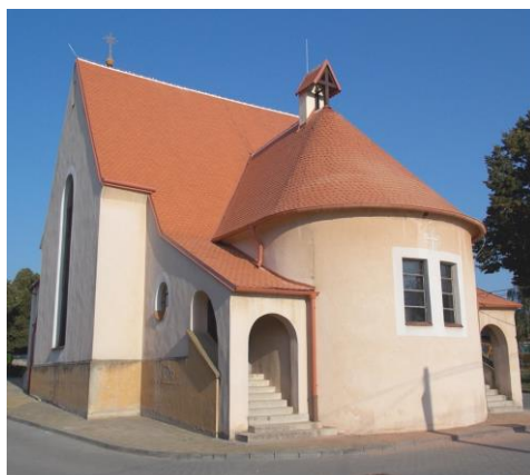
Kostel Zasnoubení Panny Marie v Mackovičích – I. etapa opravy střechy (796.000 Kč)