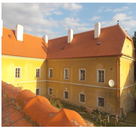
Fara v Oleksovicích – IV. etapa opravy střechy vč. výměny krovy (590.000 Kč)