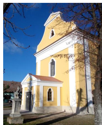
Kostel sv. Jiří ve Strachotičích – I. etapa opravy fasády (615.000 Kč)