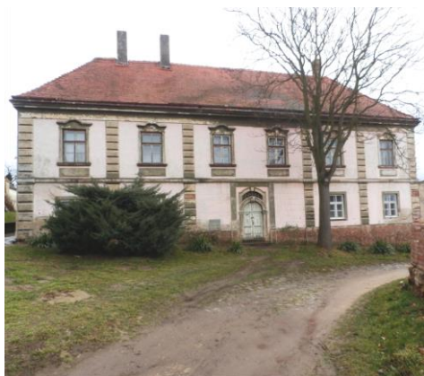
Fara v Dyjácovicích – I. etapa opravy střechy vč. výměny krovu (650.000 Kč)