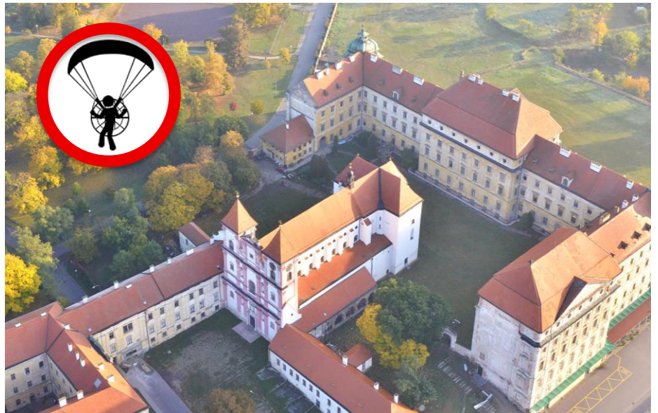
Nad Louckým klášteřem s kostelem Nanebevzetí P. Marie a sv. Václava bude zakázáno přeletávat s paraglidem

Podle vyhlášky Ministerstva kultury není možné NKP navštěvovat zdarma. To znamená, že všichni návštěvníci kláštera i kostela budou nuceni uhradit vstupné. Vedení farnosti se nyní snaží vyjednat výjimku pro své farníky, aby jim byl zajištěn bezplatný přístup alespoň na bohoslužby. Zda se to podaří, není zatím vůbec jisté. V nejhorším by tak na zaplacení vstupenek mohla padnout celá nedělní sbírka a ani to by nemuselo stačit zejména v zimních měsících, kdy je návštěvnost zdejšího kostela kvůli chladnu, které v kostele panuje, slab-