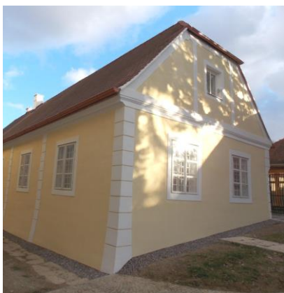
Fara v Hlubokých Mašůvkách – oprava fasády a statické zajištění (647.000 Kč)