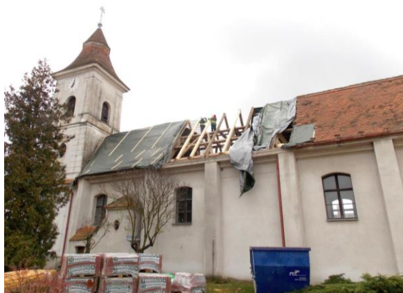
Kostel sv. Jiljí v Lukově – I. etapa opravy střechy a krovu (737.000 Kč)