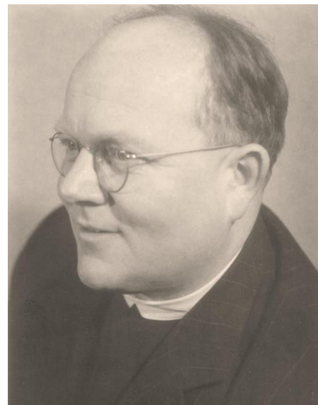
R.D. Josef Stria

Co říci na závěr vyprávění vzpomínek na dobu před více než půlstoletím? Především nesmíme připustit, aby se na ni zapomnělo. Hlavně mladá generace se musí