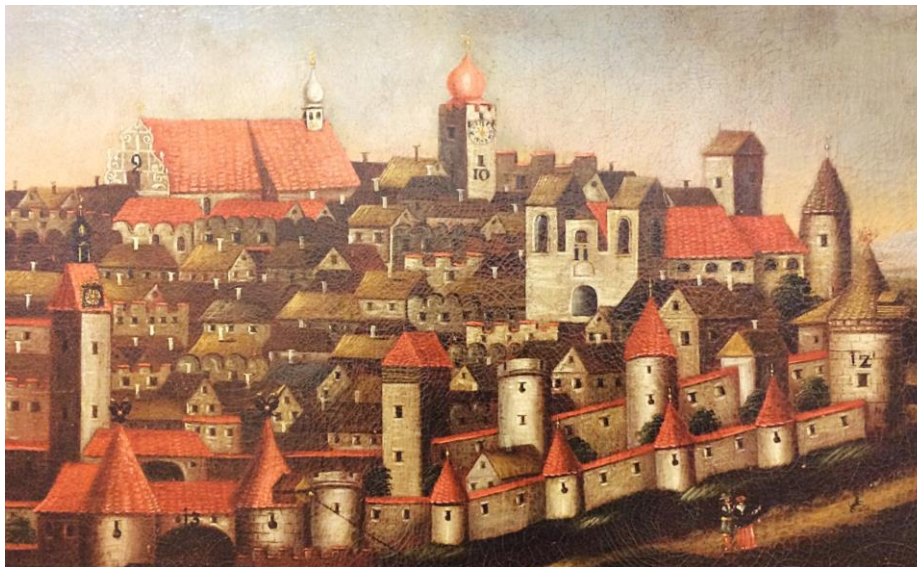
Výřez z veduty města Znojma z roku 1688 zachycuje podobu kostelů sv. Michala (9) a sv. Kříže (11) v době jejich svěcení (1677). Věž mezi nimi (10) je dnes již zbořená věž Horní brány. Svatomichalská zvonice byla postavena až o několik let později.

V celé církvi se slaví posvěcení chrámu, který je považován za matku všech křesťanských kostelů. Který to je? Je jím Late-ránská bazilika v Římě, což je katedrální kostel římského biskupa tedy papeže. K je-