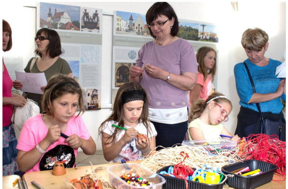
Tvůrčí dětská dílna ve Svatováclavské kapli