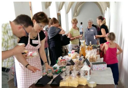
V rámci misijního jarmarku bylo skutečně z čeho vybrat

V rámci farního dne se konal první (nebo možná „znovu první“) misijní jarmark. Kreativní tým se totiž našel (viz farní časopis květnové číslo). Jsem moc ráda, že se sešlo tolik ochotných a kreativních lidí, kteří svoje nápady přetvořili v konkrétní věci, které se prodávaly v našem improvizovaném stánku v křížové chodbě dominikánského kláštera. Prodávaly se malované, drátkované, modelované, pletené a ušité věci, pečené, sušené a namíchané dobroty, nudle, sirupy, sazeničky bylinek a jiné rostliny. V rámci naší misijní akce také