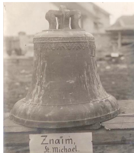
Sanktusníček z kostela sv. Michala

V sobotu 24. února 1917 byly zvony z farnosti sv. Kříže spolu s ostatními zvony