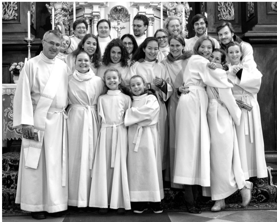
Velikonoce 2017