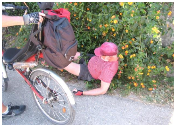
Cyklopout' nebyla žádná procházka růžovým sadem, i když tento účastník v růžovém keři skončil. Poznáte, o koho se jedná?