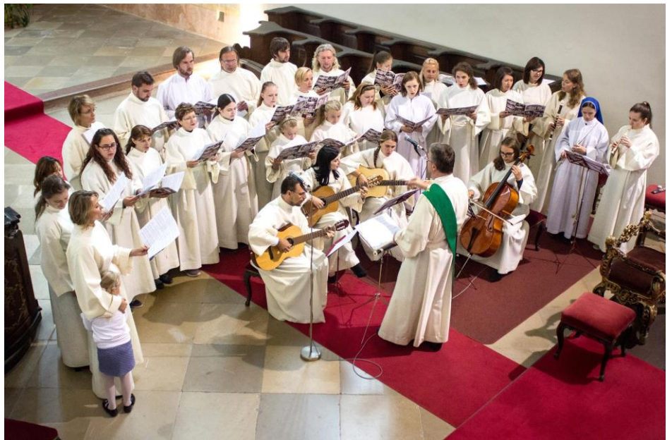
Schóla při nedělní bohoslužbě při oslavě 25 let svého trvání

Oproti chrámovému sboru, jehož místo bývá zpravidla na kůru u varhan, což je z akustického hlediska nejvhodnější místo v kostele pro jím provozované vícehlasé skladby, má být schóla umístěna v blízkosti oltáře, resp. v přední části kostela. Pro řadu schol, stejně jako tu naši u sv. Mikuláše ve Znojmě je typické, že je při vykonávání své služby při liturgii oblečena do jednotného oděvu - bílé řízy. Naše svatomikulášská schóla od doby svého vzniku zpívá téměř každou neděli při farní mši, o velkých svátcích a při zvláštních církevních příležitostech zpívá vedle jí vlastních liturgických zpěvů i vícehlasé skladby či rytmické křesťanské písně s doprovodem kytar, houslí, fléten a violoncella. Některé z těchto písní vyšly ve dvou albech v letech 2000 a 2002. Pravidelné zkoušky schóly probíhají každý týden mimo letní prázdniny, stálých členů je kolem dvaceti, o nedělích se schází kolem desíti zpěvaček a zpěváků, za dobu existence schóly jí prošlo přes sto lidí.