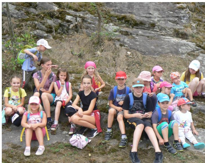
Výuka náboženství se nemusí odehrávat jen ve školních lavicích

2. Každá hodina je jedinečná. Záleží na tom, v jaké náladě děti jsou, jak jsou unavené, co ten den prožily a podle toho se snažím výuku přizpůsobit. I když mám připravený program a nějakou představu, co bych chtěla s dětmi zvládnout, vždy je pro mne důležitější vycházet z momentální situace a když se někdy více zastavíme nad nějakým tématem či problémem, je lepší ho s dětmi podle jejich potřeby probrat do hloubky, než za každou cenu splnit „plán“. Pro mne je důležitější, že jim někdo naslouchá a z hodin odejdou třeba i povzbuzeni, než za cenu splnění mé představy. Na začátku i na konci hodiny se vždy modlíme, někdy si i zazpíváme, pokud je čas, chodíme i do farní kaple, kde mám pocit, že mohou více zažít ztišení a blízkost Ježíše. V modlitbě je pomalu učím, jak se otevírat Bohu, vyslovit své touhy nahlas i před ostatními, zažívat modlitbu ve společenství. Prostě je