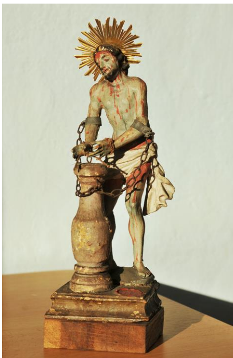
Zázračná soška Bičovaného Spasitele z kostela v Dyji