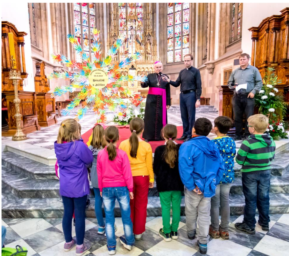
Barevná monstrance vytvořená dětmi, které letos přistoupily k prvnímu sv. přijímání, při společném setkání v Brně na Petrově

A konečně jsme došli na Petrov ke katedrále. Tam už nás hezky přivítali, dostali jsme každý žlutý náramek, aby nás pustili všude, kde byl pro nás nachystaný program. Hned při vstupu do katedrály jsme vyráběli pro otce biskupa dárek. Byla to obrovská monstrance a každý z nás tam obkreslil pro otce biskupa svoji ruku a napsal mu tam třeba i nějaký pozdrav, či nakreslil obrázek a své jméno. Páni, z rukou dětí, které byly na Petrově, z toho vznikla obrovská monstrance. Vždyť nás tam bylo celkem 400. Kdo ještě chtěl, mohl jít i ke zpovědi, a pak už jsme jen celí natěšení čekali, až začne mše svatá a přijde pan biskup. Po mši svaté pro nás