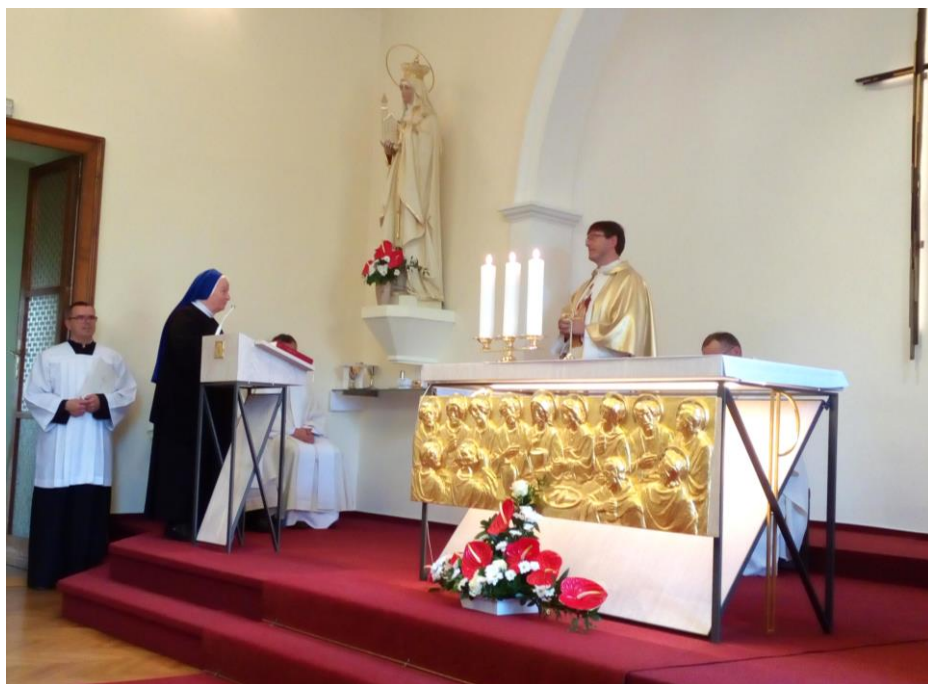
V Břežanech byl posvěcen nový oltář s původním vyobrazením Poslední večeře Páně.

V kapli, kterou sestry pravidelně využívají k modlitbě a slavení mše svaté, byl 16. 10. 2018 požehnaný nový oltář a presby-