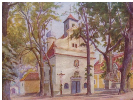
Starý mašůvský kostelík s válečným pomníkem vpravo pod lipami.