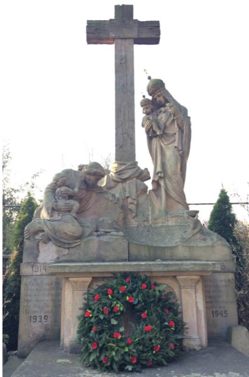
Pomník v Mašůvkách vzdává poctu válečným obětem z celého Znojemska.

se nesou k vyobrazeným křížkům označujícím hroby vojáků na vzdálených bojištích. V tu chvíli žena zapomíná i na vlastní dítě, které se marně domáhá jejího prsu. Před sochou Panny Marie se ze země vypíná ruka držící obětní misku. Ta symbolizuje obět mše svaté přinášené za padlé vojáky na oltáři, který je součástí pomníku.