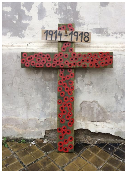
Sté výročí od konce první světové války připomněl při bohoslužbě i kříž se 100 „průstřely“ obklopenými vlčími máky, které platí za symbol válečných obětí. Kříž byl následně umístěn u presbytáře kostela sv. Michala.