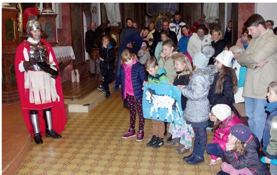
11. listopadu na svátek sv. Martina dorazil do kostela sv. Kříže i sám sv. Martin, aby se zúčastnil požehnání mladého vína. Děti mu při té příležitosti vytvořily krásného bělouše. (Více ve Stalo se.)