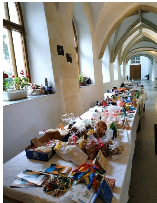
V neděli 9. prosince 2018 bylo možné v křížové chodbě dominikánského kláštera navštívit misijní jarmark a koupit si některý z mnoha s láskou připravených výrobků.

Ještě bych touto cestou chtěla poprosit, abyste mi opravdu nosili jen Vaše výrobky. Sešlo se mi i pár tašek věcí, které se našly doma, a třeba pro ně nebylo jiného využití. Moc si toho vážím a vím, že se snažíte pomoci, ale chtěla bych tuto akci ponechat jako jarmark rukodělných výrobků. Letos jsme udělaly stoleček těchto bazarových věcí za dobrovolný příspěvek. Ale moc se toho neprodalo a s takovými věcmi potom běhám na charitu. Děkuji za pocho-pení. Papežské misijní dílo má nabídku dalších aktivit, jejichž výtěžek putuje tímto smě-