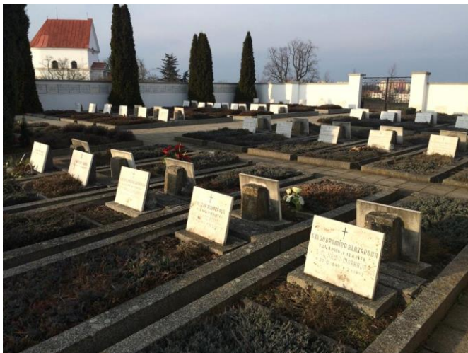
Stovky jmen na náhrobcích sester boromejek na hradištském hřbitově.

mov. Dalo by se říct, že to bylo v dané situaci docela dobré řešení. Časem tam měly poměrně přijatelné podmínky k běžnému i duchovnímu životu. Společenství milosrdných sester se přičinilo o potřebné rekonstrukce budov a také zvelebovalo zahradu. Jeho zásluhou se dočkaly obnovy rovněž silně poškozené památné kapličky