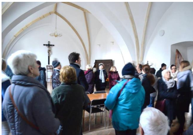
Návštěvníci prohlídky zavítali i do jedné z nejstarších částí dominikánského kláštera – gotické kapitulní síně.

Prohlídka byla dlouhá a náročná, přesto jen málokdo odešel předčasně. Když pod hudební kruchtou kostela upozornil Ondřej Lazárek na personifikaci hlavních křesťanských ctností Víry, Naděje a Lásky a připomněl slova sv. Pavla, že Lásky je největší