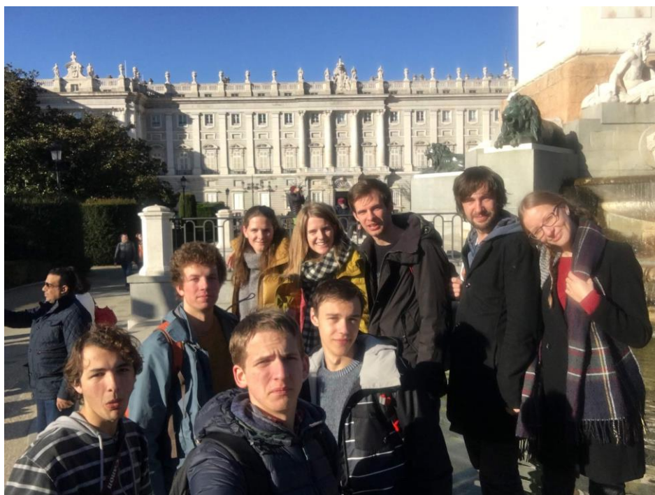
Znojmejší zástupci na setkání Taizé v Madridu.

Ve farnosti nám bylo přiděleno ubytování a my se rozdělení do dvojic dostáváme ke svým rodinám, někteří i do kláštera. Všichni naši hostitelé jsou moc milí, a i když