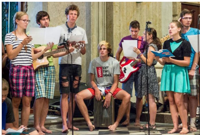
Večery chval v podání znojemské mládeže.

Zprv máme rádi Boha a máme rádi hudbu, tak jej chceme chválit tak, jak je nám to blízké – hudbou. To je proč to děláme :).