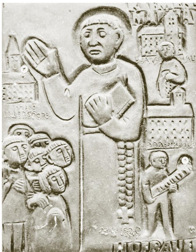
Plastika sv. Klementa v pokloně u Tasovic.

V roce 1771 vykonají oba tovaryši druhou římskou pouť. Tehdy je přijme do poustevny nedaleko Tivoli zdejší biskup Chiaramonte, pozdější papež Pius VII. Hofbauer přijímá jméno Klement podle sv. Klementa z Ankyry, poustevníka a mučedníka, a Kunzmann jméno Emanuel. Nesetrvávají zde dlouho. Po několika měsících se vracejí do vlasti. Dvacetiletý Klement může nastoupit do klášterní latinské školy v Louce. Pro svůj věk a mohutný vzhled je mladšími spolužáky přezdívan „Goliášem“. Během čtyř let studia zde potkává svého nového přítele Tadeáše Hýbla, syna revírníka z Čermné u Lanškrouna. V Tadeášovi najde Klement nerozlučného druhá, který mu bude stát věrně po boku až do své smrti v ro-