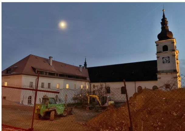
O klášterní areál se dočasně dělíme s těžkými stavebními stroji, dokud nás zcela „nezadí“ ☺.

„A když se jeho oblak zase znovu zvedne a ukáže nám nový směr, půjdou jeho snoubenky za Ním, kamkoli On půjde. Vždyť jsme Řád kazatelský, Řád putující, a naše vlast není na této zemi, ale očekáváme budoucí!“