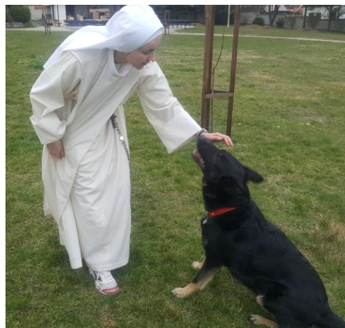
Velkou radostí je pro nás také dostatečně velká zahrada, která je součástí kláštera. Úsměvným bonusem k zahradě je zdejší hlídač. Krásný německý ovčák – Tara.

Poznámka redakce: Pravidelně v měsíci dubnu proběhne posvěcení a uzavření papežské klauzury nového kláštera arcibiskupem Graubnerem. Předtím sestry v klášteře plánují den otevřených dveří, na který srdečně zvou i znojemské farníky. Termíny akcí bude zveřejněn na webových stránkách sester: mnisky.op.cz