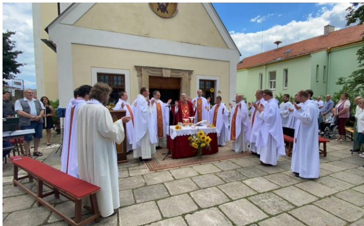
Slavnostní bohoslužba před přímětickým kostelem.