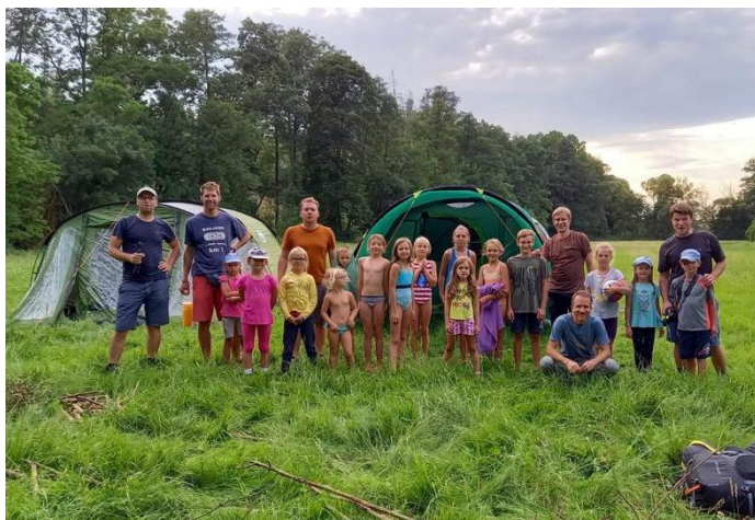
Účastníci expedice Antykor v údolí řeky Rokytné.