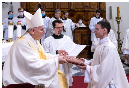
Předávání evangeliáře při jáhenském svěcení v Brně.

univerzitě v Brně. Brzy po křtu jsem začal vnímat, že mě Bůh volá ke kněžství. Bylo však potřeba počkat, aby povolání uzrálo. Nakonec jsem dospěl k tomu, že budu pokračovat ve studiu, takže jsem až do roku 2014 studoval teoretickou matematiku.