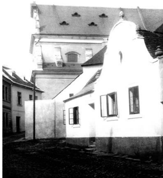
Kostel sv. Michala při pohledu z Veselé ul. (20. léta 20. st.). Za první republiky centrum náboženského života znojmských katolíků.

Česká prosebná bohoslužba koná se v den sv. Marka v pondělí 25. t. m. o 8. hodině ranní u sv. Michala ve Znojmě. Katolíčtí rodičové! Vaším právem, ministerským výnosem vám zaručeným, jest žádati o dovolenou od školního vyučování pro vaše