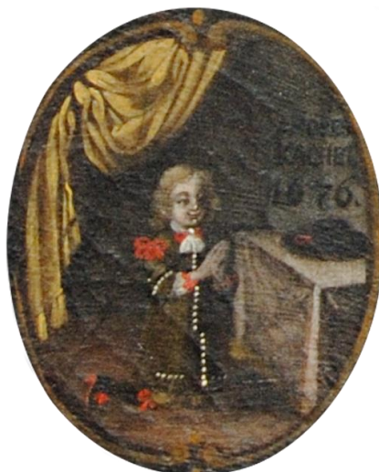
Medailon s modlícím se chlapcem Ondřejem Kachellem a nápisem: ANDRES KACHEL 1676

Teprve po roce 1712, kdy byl přesunut na pilíř sousední kaple, začalo se u obrazu