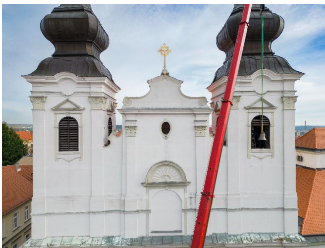
Vyzdvihnutí nejmenšího zvonu Josef.

Po požehnání nových zvonů v kostele sv. Kříže 15. října 2022 nebylo možné kvůli komplikacím na straně dodavatelské firmy, způsobené dlouhodobými nemocemi zaměstnanců, uskutečnit hned jejich vytažení do věže. Termín prvního zvonění byl proto určen až na neděli 20. listopadu, která bude předcházet datu 300. výročí schválení veřejné úcty u obrazu Panny Marie Znojemské (23. 11. 1722). Na návštěvu se nahlásil kardinál Dominik Duka, který má jako dominikán ke zdejšímu klášteru a kostelu blízký vztah. No uvidíme, snad všechno klapne a neuděláme si ostudu.