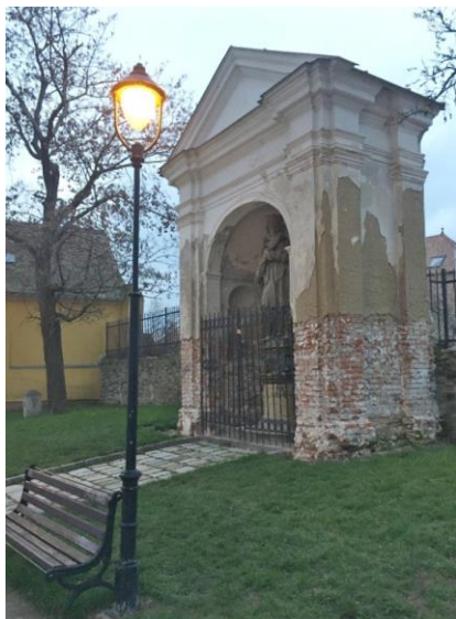
Aktuální stav kaple sv. Jana Nepomuckého u kostela sv. Michala.

Svatý Jan Nepomucký býval svého času nejoblíbenějším českým světce, jehož