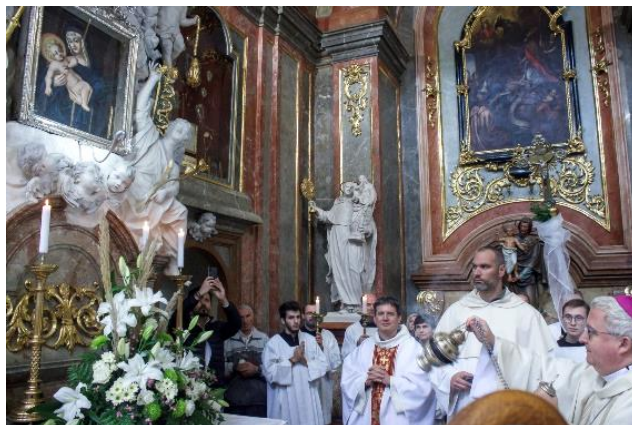
Modlitba u obrazu Panny Marie Znojemské.

Slavnost byla ukončena společnou modlitbou u obrazu Panny Marie Znojemské a slavnostním zpěvem hymnu Te Deum. Věřícím, kteří zcela kostel zaplnili, se ale domů nechtělo. Sešli se proto v sále kláštera, kde pro ně bylo nachystané pohoštění a kde se následně až do pozdních odpoledních hodin povídalo, popíjelo a veselilo. Na rozžářených pohledech věřících bylo po-