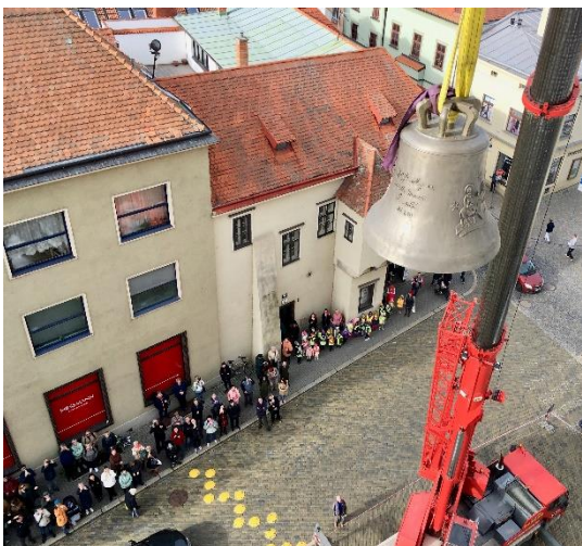
Výjimečnou událost, která se naposledy u kostela sv. Kříže odehrála v roce 1926, sledovalo mnoho lidí.

Po požehnání nových zvonů v kostele sv. Kříže 15. října 2022 nebylo možné kvůli komplikacím na straně dodavatelské firmy, způsobené dlouhodobými nemocemi zaměstnanců, uskutečnit hned jejich vytažení do věže. Termín prvního zvonění byl proto určen až na neděli 20. listopadu, která bude předcházet datu 300. výročí schválení veřejné úcty u obrazu Panny Marie Znojemské (23. 11. 1722). Na návštěvu se nahlásil kardinál Dominik Duka, který má jako dominikán ke zdejšímu klášteru a kostelu blízký vztah. No uvidíme, snad všechno klapne a neuděláme si ostudu.