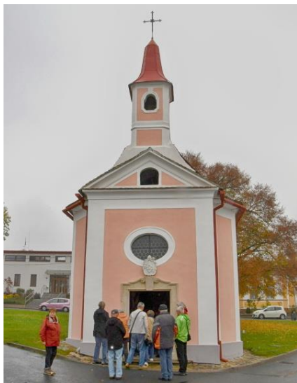
Kaple v Podmolí.

dí posilu a naději, když mnohdy nelibostné kolo dějin bylo znamením jejich osudů.