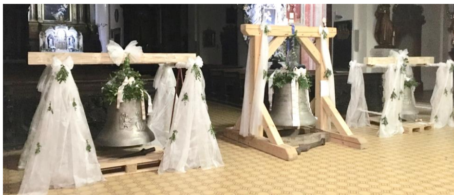
Svátečně oděná Svatá Rodina: Maria, Ježíš a Josef. | Foto archiv redakce