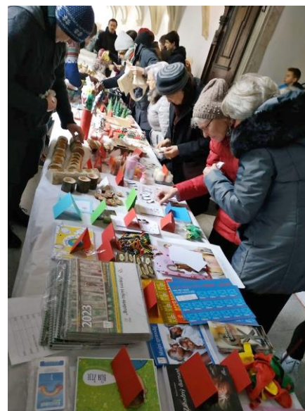
I letos bylo na misijním jarmarku z čeho vybrat – chodba dominikánského kláštera.