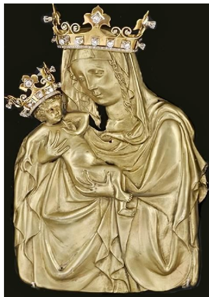
Kovový reliéf Panny Marie Staroboleslavské, jehož volnou reprodukcí je obraz P. Marie Znojemské. Reliéf je označován jako PALLADIUM (ochranný obraz) země České a stal se nejpouštělnějším mariánským vyobrazením u nás.

V původně dominikánském kostele Nalezení sv. Kříže ve Znojmě je uchováván obraz Madony, který byl rozhodnutím olomouckého biskupa před 300 roky 23. listopadu 1722 prohlášen za "zázračný". Vyobrazení Panny Marie s Ježíškem, tradičně označované jako Panna Maria Znojemská, si získá-