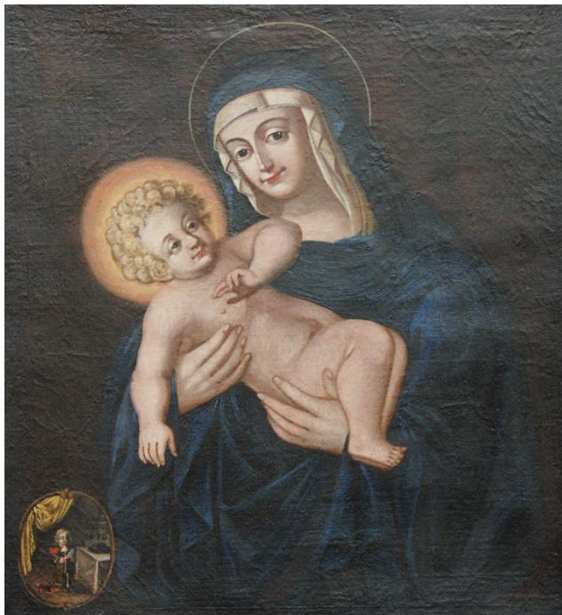
Na plátně malovaný obraz Panny Marie Znojemské titulované místními dominikány jako THAUMATURGA NOSTRA (Naše Divotvůrkyně).

V původně dominikánském kostele Nalezení sv. Kříže ve Znojmě je uchováván obraz Madony, který byl rozhodnutím olomouckého biskupa před 300 roky 23. listopadu 1722 prohlášen za "zázračný". Vyobrazení Panny Marie s Ježíškem, tradičně označované jako Panna Maria Znojemská, si získá-