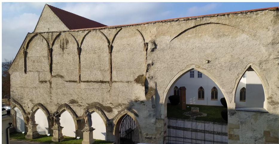
Torzo dělicí přičky chrámu Matky Boží s patrnými otisky kleneb chóru klarisek v patře. Arkádami v přízemí šlo prostoupit z boční do hlavní chrámové loď.

Školní areál se nachází na hranici mezi středověkým areálem města Znojma a předhradím znojemského markrabského či královského hradu. V roce 1271 zde král a markrabě Přemysl Otakar II., na podnět své tety sv. Anežky České, založil sdužený klášter minoritů a klarisek se společným kostelem Nanebevzetí Panny Marie, z něhož se dodnes dochovalo působivé torzo s otisky vysokých gotických kleneb. Dvojitému klášteru se v následných staletích běžně říkalo „ U Matky Boží “. Obchodní akademie dnes využívá pozemků příslušících k té části kláštera, kterou obývaly klarisky. Z gotického kláštera klarisek se nedochovalo žel nic. Měl velmi skromnou podobu rajskeho dvora obehnaného čtyřmi křídly křížové chodby, k severovýchodnímu křídlu přiléhá obytný trakt s dormitářem v patře. Na daném místě dnes stojí školní tělocvična (postavená roku 1928/1935), volejbalové hřiště a asfaltová plocha, vyu-