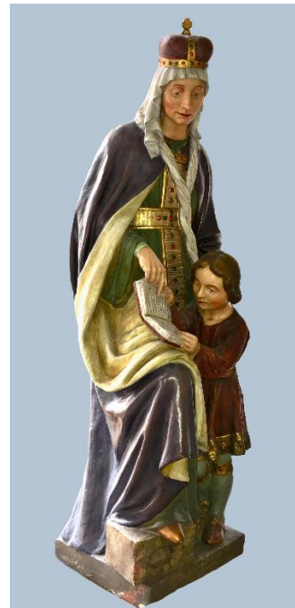
Sádrové sousoší sv. Ludmily a sv. Václava v pořizené pro kostel sv. Michala v roce 1922 bylo původně umístěné na oltáři sv. Jana Nepomuckého. Dnes se nachází v depozitáři.

Den Svobody oslaven byl ve Znojmě přesně dle stanoveného pořádku. V sobotu ráno sloužil vldp. P. Aug. Strnad, převor dominikánů, za velké přísluhy duchovenstva u sv. Michala slavnou mši sv. za vlast a národ, k níž se dostavilo kromě zástupců úřadů občanských a zvláště vojenských tolik katolíků české národnosti, že svatomichalský kostel byl nabit.