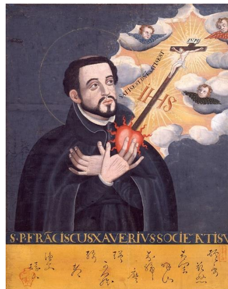
Svatý František Xaverský

vat hříchu či jak zpytovat svědomí. Kromě toho jej trápily nejrůznější neduhy. Vedle zkrácené, bolavé nohy, to byly i bolesti žaludku (při pitvě jeho těla bylo zjištěno, že se jednalo o žlučové kameny). Brzy získal okruh přátel, kteří se nadchli pro „nový“ životní styl. A zde narazil na neslavně proslulou španělskou inkvizici, které byl trnem v oku Ignácův „apoštolský styl“ působení. Vzhledem k tomu, že ještě nebyl knězem, byl mu takovýto způsob evangelizace zapovězen. Ignác si za toto počínání vysloužil dvaatřicet dní v inkvizičním vězení. Po propuštění opustil Alcalá a vydal se do Salamanky, kde jej znovu čekal inkviziční soud a nové uvěznění. Tato dvojitá neblahá zkušenost přiměla Ignáce k odchodu do Paříže. Zde studoval za podpory dobrodinců a v roce 1534 dokončil tříletý filozofický kurz na koleji sv. Barbory v Rue Valette a získal titul magistra filozofie. A právě zde nalezl další spřízněné duše – muže, kteří vytvořili jádro pozdějšího Tovaryšstva. Jmenujme především savojského rodáka Petra Fabera, Portugalce Šimona Rodrigueze a Františka Javiera (Xaverského) z Navarry. S nimi se Ignác věnoval duchovním cvičením, jejichž základ vznikl už v Manrese. Všichni se zavázali dodržet slib čistoty a chudoby a slavnostně tyto své závazky potvrdili v kapli Panny Marie na pařížském Montmartru v roce 1534. Tak vlastně byly položeny základy pro budoucí Tovaryšstvo Ježíšovo (Societas Jesu) neboli jezuitský řád.