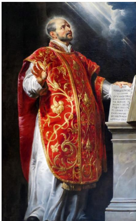
Ignác z Loyoly (P. P. Rubens)

Stalo se to u města Pamplona – hlavního města navarrského království a klíčové pevnosti poblíž francouzské hranice – při jeho obléhání vojsky francouzského krále Františka I. 20. května 1521. Devětadvacetiletý Iñigo López de Loyola, baskický šlechtic, hledající životní štěstí v kariéře válečníka byl při obraně jedné z bašt pamplonských hradeb ošklivě poraněn dělovou koulí. Statečnému obránci, který se odmítl Francouzům vzdát, roztráštěla koule holenní kost pravé nohy a lehce poranila nohu levou. Tehdy stanul Iñigo poprvé na prahu smrti... Ta se mu však vyhnula, a tak toto osudové zranění otevřelo cestu k jedné z nejvýraznějších životních konverzí, ze které vzešel snad nejvýznamnější z duchovních řádů raně novověké Evropy – Tovaryšstvo Ježíšovo zkráceně jezuité. Ale to bychom předbíhali. Začneme tedy popořádku.