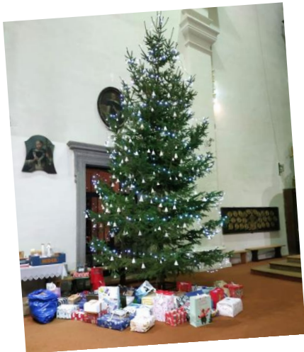
Velký vánoční strom v kostele sv. Kříže v obležení dárků pro ukrajinské děti.

Na začátku stála nepatrná myšlenka a pár obyčejných věcí. Žádná velká organizace. Celý tento projekt měl jediný cíl. Udělat pod stromečkem radost ukrajinským dětem a jejich maminkám, kteří jsou ubytováni na faře a v klášteře naší farnosti. Přinést jim vědomí toho, že na ně někdo myslí. Vánoce pro ně nebyl jednoduchý čas. Daleko od domova, bez manželů a tatínek, bez svých kamarádů, sousedů, paní učitelek atd. Plakát byl v kostelích, dopisy rozdané dětem, aby si napsaly svoje přání a vhodily je do schránky. Čekali jsme, co bude. Přicházely myšlenky, že kdyby se dopisy nevyzvedly všechny, jak to udělat, aby se na všechny dostalo. V takových případech obracím oči k nebi a říkám: Někoho mi, prosím, pošli. Poslal... Tolik dobrých duší, že se rozdaly všechny dopisy a ještě dva týdny zvonil telefon, jestli nějaký dopis nezbyl. Dobrodinci sháněli s velkou snahou maximálně vyho-