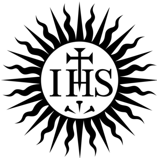
Znak jezuitského řádu.

Prvním sídlem Tovaryšstva Ježíšova se v Římě stal domek vedle kostela S. Maria della Strada. Odtud první jezuité vycházeli na svou misií do Evropy a do zámorí. Snad nejslavnějším misionářem všech dom se stal Ignácův druh František Xaverský, který se na pokyn portugalského krále vypravil na „pout“ do Východní Indie, kde našel smrt a stal se vzorem pro další generace jezuitských misionářů. Velký význam měla i římská řádová kolej – Collegium Romanum – založená v roce 1551.