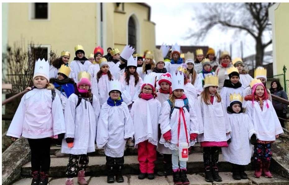
Malí tříkráloví koledníci u kostela v Přiměticích.

Už nyní víme, že letošní sbírka pomůže lidem v sociální tísní prostřednictvím naší Charitní záchranné sítě, kde pomáháme těm nejpotřebnějším. Rozdáváme potravinové balíčky, v zimním období teplou polévku, pečivo a zeleninu, oblečení a poskytujeme sociální poradenství. Mladému muži přispějeme na elektrický invalidní vozík,