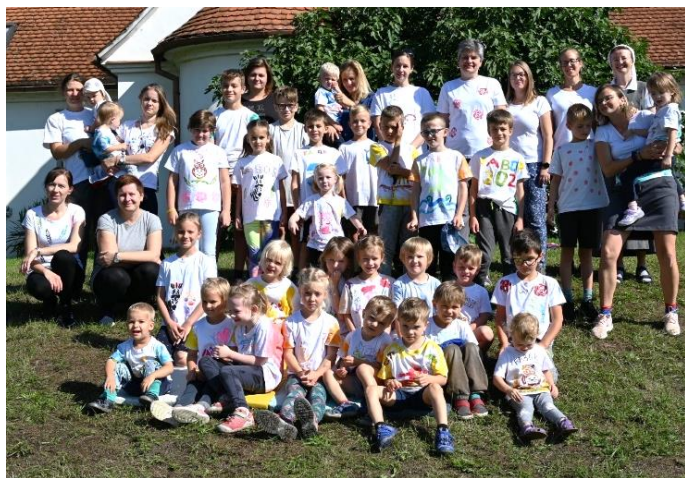
Na faboře se děti seznamovaly s biblickým příběhem.

Třetí den jsme plánovali výlet do Podyjí s příběhem o Babylonské věži. Ráno jsme bedlivě sledovali všechny možné aplikace s počasím, až jsme se nakonec rozhodli, že výlet podnikneme. Až na světlé chvíly