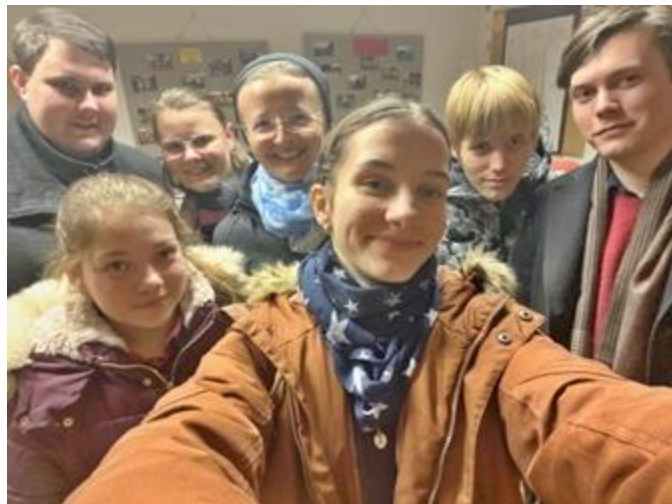
Spolčo pro mladá je otevřené pro všechny ve věku 14 až 20 let.

V posledním měsíci jsme se mohli s naším spolčem zúčastnit několika zajímavých akcí. Ať už to bylo samotné spolčo, kde seestra Viannea předvedla uchvacující katechezi o Panně Marii, následovaná mše svatá sloužená v úzkém kruhu, umožňující nám tak zakusit nepopsatelně silnou a krásnou duchovní atmosféru. Pak to byly třeba modlitby desátku růžence před našimi školami v rámci modliteb týdne za mládež. Ten