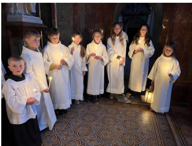
Průvod o svatodušní vigílii vedl kolem obrazu Panny Marie.

A co je to ta velígie? ptaly se zvědavé děti na ministrantské schůzce, která proběhla v sobotu před Letnicemi u kostela svatého Kříže. Proč to složitě vysvětlovat, dneska večer opravdovou vigílii zažijí. Nepředbíhejme ale.