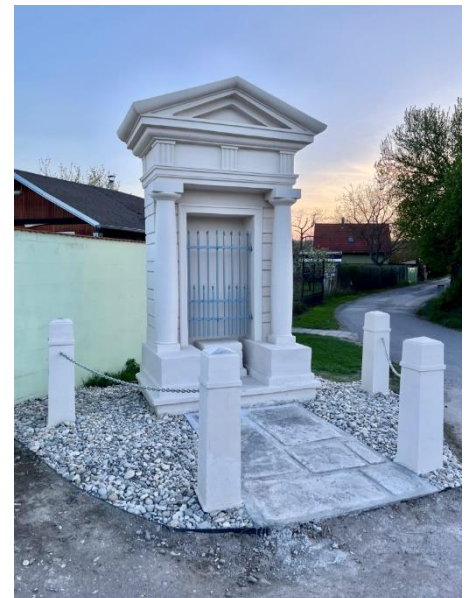
Poklona po rekonstrukci.