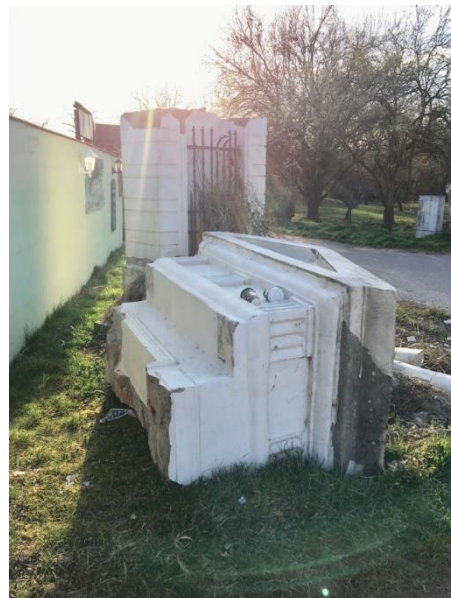
Poklona po nárazu kamionem v roce 2023.

Nově vystavěná poklona se sochou sv. Jana Nepomuckého (1937).