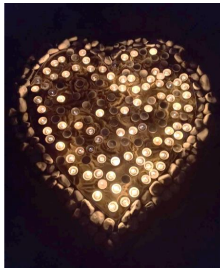
V kostele sv. Mikuláše vytvářeli návštěvníci hořící srdce.