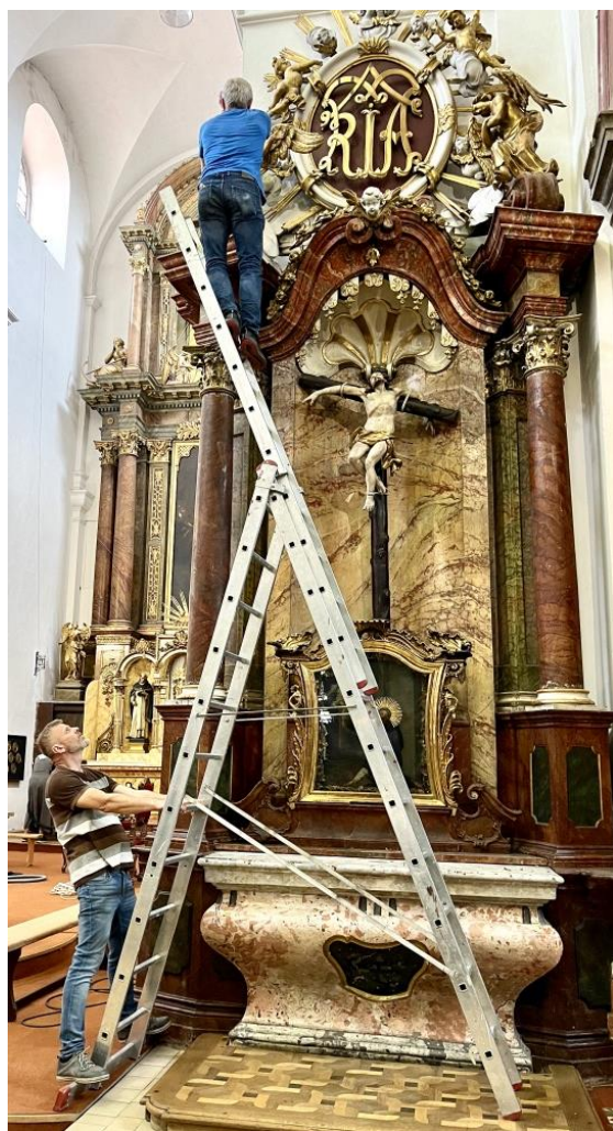
Proč musíme mít v kostel tolik oltářů?, vrtalo hlavou nejednomu účastníkovi velkého úklidu u Sv. Kříže.