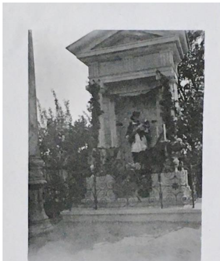
St. Johannet - Statue

Nově vystavěná poklona se sochou sv. Jana Nepomuckého (1937).