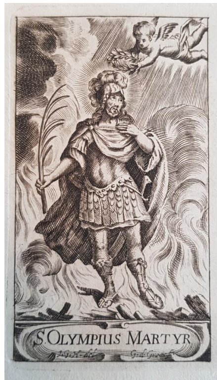
Sv. Olympius na dobovém mědirytu, 1. polovina 18. století (MZA)

Předpokládalo se totiž, že relikvie nebude utajována dlouho, nýbrž že bude co nejdříve veřejně představena, už jen proto, že to mnozí žádali. Protože však mezitím by-