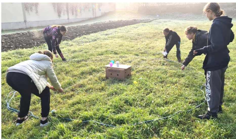
Získat klíče od pevnosti Boyard dalo pořádnou fušku.

Po 45 minutách zazněl gong, který ukončil honbu za klíči a nastala honba za indicemi, které pomohou k rozluštění hesla dne. Úkoly byly tentokrát přímo v pevnosti a šlo například o to, dopravit světlo pomocí zrcátek do sklepní kobky a přečíst písmena indicie na zdi. Nebo otáčet láhvi s rozstříhanou indicí tak dlouho, dokud se nezjevila všechna písmenka indicie. Dost