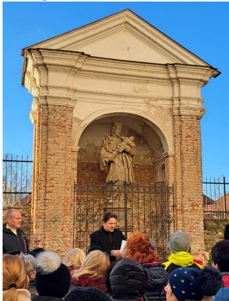
Svatojánská kaple při prohlídce uspořádané 23. listopadu 2024 Nadací pro obnovu církevních památek děkanství znojemského k 400. výročí příchodu jezuitů do Znojma.

Jak je to možné, že ta kaple je pořád tak omšelá a otlučená?