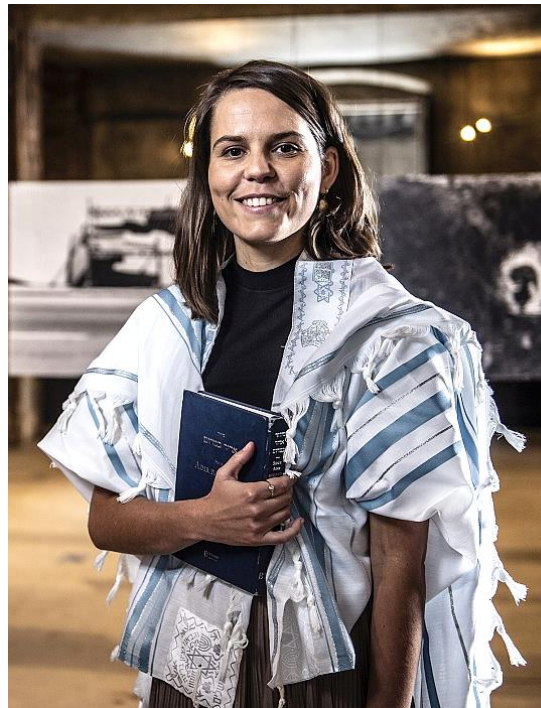
Rabínka v zácvičku.

Judaismus klade velký důraz na etiku, sociální spravedlnost a neustálé vzdělávání. Tyto hodnoty jsou podle mě velmi relevantní i pro dnešního člověka. Také oceňuji židovský přístup k diskuzi a interpretaci textů, který podporuje kritické myšlení.