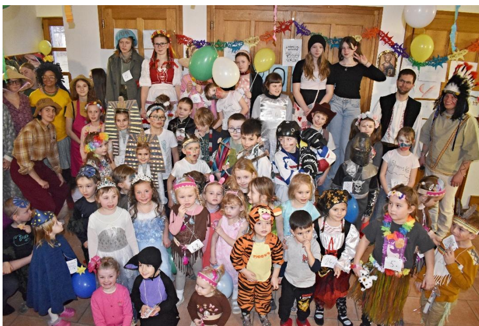
Program louckého kranevalu vzbudil u dětí velký ohlas.

ce pod vedením Evy, Martiny a Lenči Š. (z tanečního klubu Masánčata Znojmo).