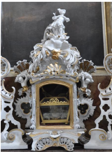
Relikviář s ostatky sv. Olympie na bočním oltáři kostela sv. Michala.

února 1680 a vyžádal si 778 lidských životů. V různých podobách pak ještě nemoc přetrvávala po celý rok 1680 a definitivně prý zmizela až na sv. Lucii. Vděčnost Znojmských za odvrácení epidemie byla vtělena do mariánského sloupu, který v letech 1680-1682 ozdobil Dolní náměstí. V nehmotné podobě pak přetrvávala ještě dalších sto let v podobě spektakulárních svatoolympijských slavností, i když dlužno podotknout, že k obnovenému zájmu o sv. Olympie došlo ještě dvakrát v průběhu 18. století.