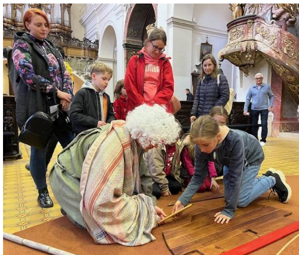
V kostele sv. Kříže se děti při plnění úkolů mohly setkat s praotcem Noem, který jim radil, jak správně postavit archu.

Jako každý rok, i letos, v pátek 23. května 2025, byly až do pozdního večera otevřené dveře znojemských kostelů, a to zejména všem, kteří do těchto prostor možná až tak často nezavítají. Dobrovolníci z jednotlivých farností si připravili bohatý program s rozmanitým zaměřením, takže vybírat bylo opravdu z čeho.