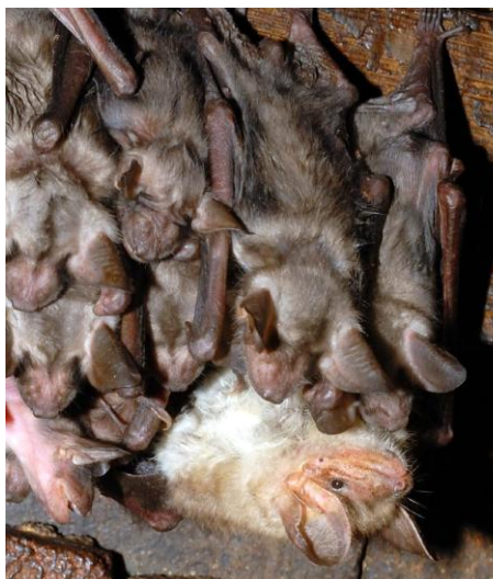
Pohled do kolonie netopýřů velkých – dospělá samička (dole) starostlivě hlídá „školku“ netopýřích mláďat starých 4–5 týdnů.

proletují, navzájem komunikují, udržují „společenský život“ v kolonii. Navíc znají ve svém okolí mnoho dalších úkrytů, které různě využívají. V některých se třeba na podzim setkávají samice, žijící v létě odděleně, se svými samčími partnery. V období pozdního léta a podzimu dochází k tzv. „swarmingu“, tedy „netopýřímu rojení“, kdy se na vhodných místech setkává množství netopýřů z celého okolí a věnují se tam sociálním aktivitám, včetně seznamování a sblížování s potenciálními partnery. Takovým místem na Znojmsku jsou například skalní stěny a rozsedliny v Podyjí. V širším kontextu střední Evropy jsou zcela unikátní Ledové sluje u Vranova nad Dyjí, kde se takto setkávají desítky tisíc netopýřů ze širokého okolí. Putují sem nejen netopýři velcí, ale i mnohé další netopýří druhy, a lokalita je tak významným centrem výzkumu života netopýřů u nás.