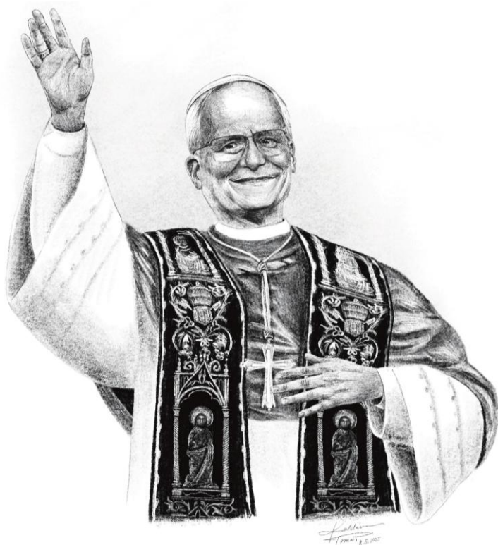
Jeden z prvních portrétů nového papeže Lva XIV. nakreslený znojemským farníkem krátce poté, co byl nový Svatý otec představen na balkónu Svatopeterské baziliky. ©Tomáš Kuldán, 2025.