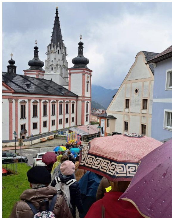
Na pouť do Mariazell vyrazily ze Znojma čtyři autobusy.

Když jsme do městečka Mariazell dorazili, pršelo. Bylo zataženo a všem bylo jasné, že dnes se nevyčáší a tohle je počasí, které bude naši pouť provázet po celou dobu. To mi bylo líto a vlastně musím říct, že jsem tady ani nic nepoznávala, náměstí, baziliku zvenku ani zevnitř, dokonce ani zlatý baldachýn, ve kterém je soška umístěna.