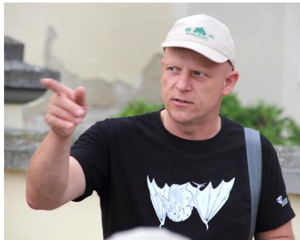
Respondent při Mezinárodní noci pro netopýry pořádané ve Znojmě.

Ano, je zde řada kostelů, kde byly nebo jsou netopýří kolonie přítomné. Kolonie netopýra velkého je např. na půdě zámecké kaple v Jevišovicích. V jiných místech se vyskytují i další druhy – netopýr dlouhouchý, netopýr večerní atd. Jenže tyto druhy netvoří tak veliké kolonie, a jsou tak mnohem méně nápadné. Případně jejich kolonie nejsou v čase tak stálé jako u netopýra velkého a v jednotlivých objektech se objevují jen v některých letech. Většinou si jich správci objektů všimnou teprve v momentě, kdy se na konci léta učí mláďata létat a využívat svoje okolí k životu. Tehdy, stejně jako všechna mláďata, si hrají, lezou kam nemají, zkouší nové věci – takže dost často pronikají i dovnitř kostelních lodí a sakristií, spouští zde v noci pohybová čidla zabezpečovacích alarmů a trápí tak správce objektů opakujícími se planými poplachu. Kostelů,