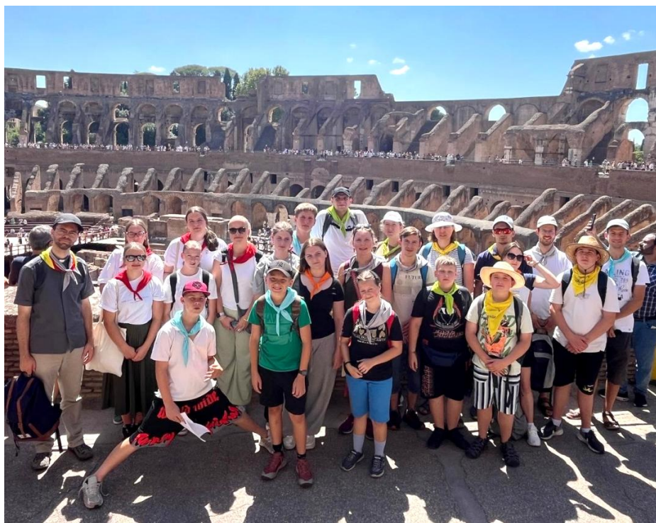
Znojemští mladí poutníci na troskách Kolosea.

V sobotu ráno jsme se rozdělili: část výpravy zamířila k hrobu papeže Františka a prošla svatou branou v Santa Maria Maggiore, druhá skupina se pak přidala u kolosea a pak jsme všichni pokračovali