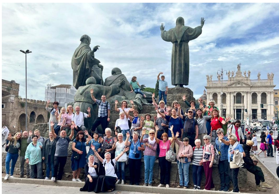
Znojemští poutníci vzali zteč sousoší sv. Františka před Lateránskou bazilikou.