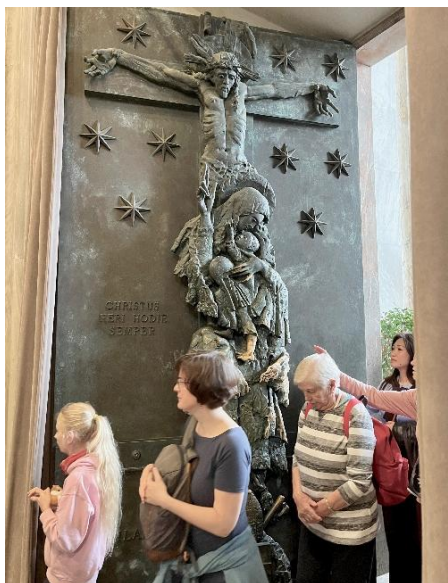
Průchod Svatou branou v Lateránské bazilice.

Podle zadání má celý příspěvek obsahovat asi sedm vět, ale jak tu dlouhou řadu zážitků z pouti popsat v krátkém textu? Vždyť jsme viděli tolik překrásných míst, navštívili jsme rušný Řím i opuštěné hluboké lesy, kudy chodíval František z Assisi, modlili jsme se v honosných bazilikách i v horských svatyních a obdivovali jsme úchvatná díla geniálních umělců. Setkali jsme se tváří v tvář se Svatým otcem Lvem XIV., prosili o Boží milosrdenství ve Svatých branách a z nespočetných duchovních prožitků budeme čerpat ještě dlouho. O našem putování by se dala napsat celá kniha, ale pokusím se vystihnout alespoň to hlavní, co naši pouť charakterizovalo.