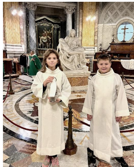
Naši ministranti v zákristii všech zákristii v bazilice sv. Petra ve Vatikánu.