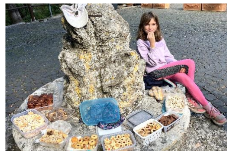
Vánoční cukroví už v říjnu? Proč ne, když jste v Grecciu, kde jsou každý den Vánoce.